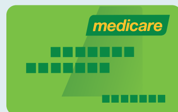
Kadi ya Medicare

Ukifika Australia, utatumiwa kadi ya Medicare.