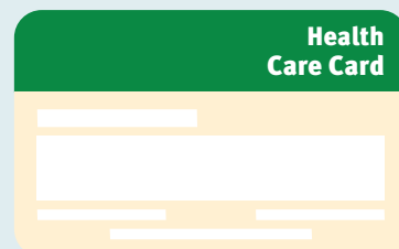
Kadi ya Huduma ya Afya

Kadi ya Huduma ya Afya ni ya watu wenye kipato cha chini na inaweza kukusaidia kupata baadhi ya huduma za afya na kupata baadhi ya dawa ulizoandikiwa na daktari kwa bei nafuu. Kawaida, kadi hii haisaidii kwa gharama za vitamini na virutubisho.