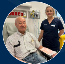
당일 종양 센터

에잇 마일 플레인스 위성 병원은 다음과 같은 예약 기반 서비스도 제공합니다.