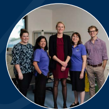
보조 의료 서비스